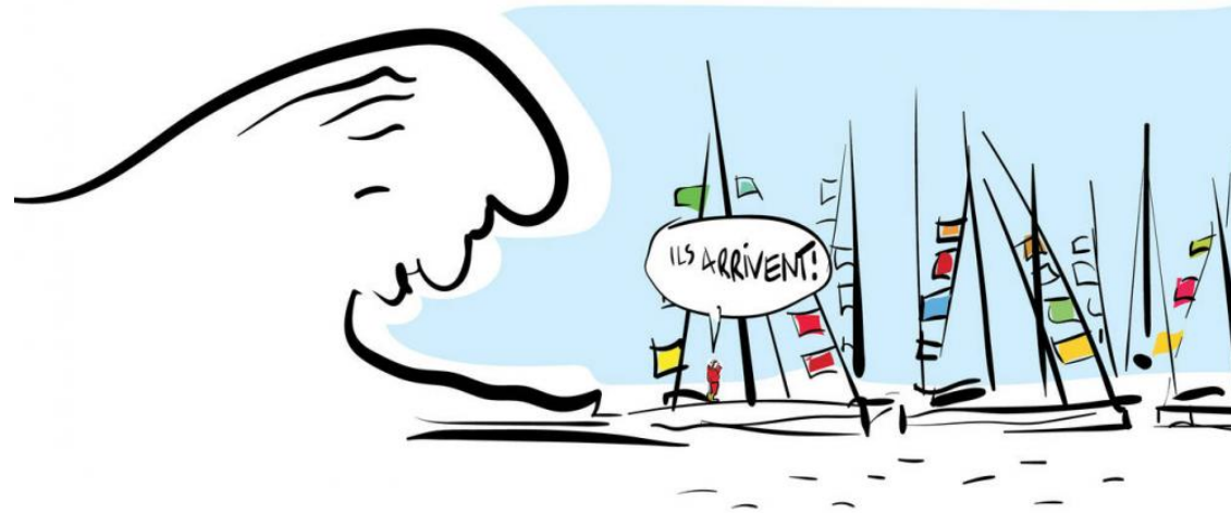
Affluence sur les pontons du Vendée Globe

Cliquez ici pour accéder à votre espace licencié